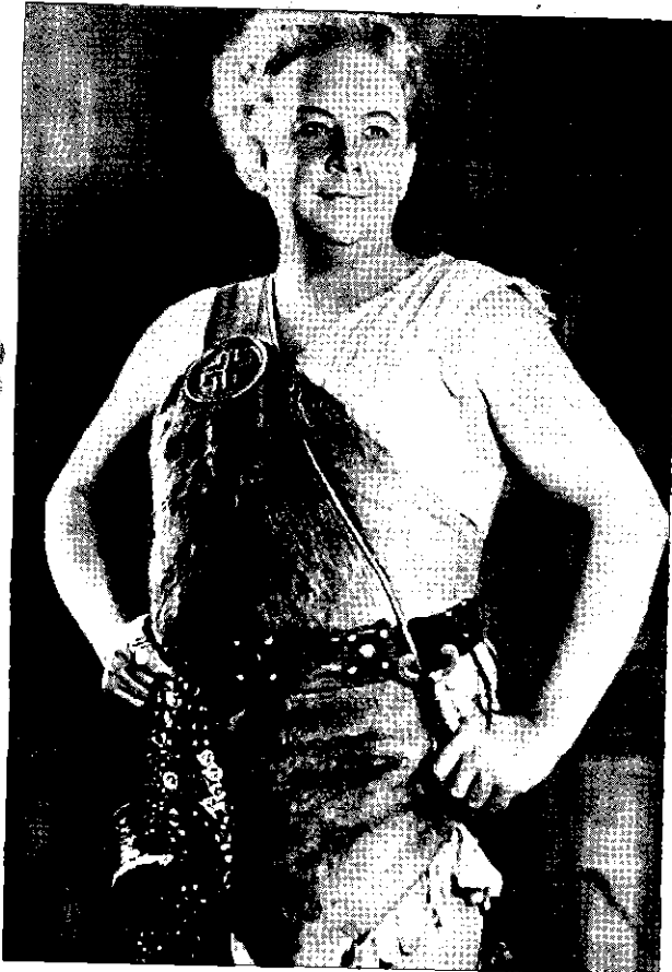
Lauritz Melchior som Siegfried - en af hans mange glansroller som Wagner-sanger.

• Telefon 99353535 Fax 99353375 E-mail kultur@nordjyske.dk Adresse Langagervej 1, 9220 Aalborg Ø