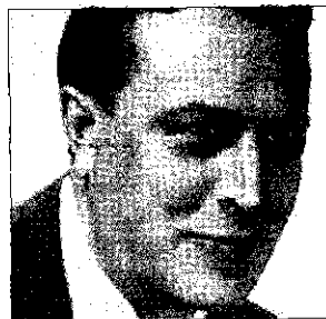
Basbaryton Kim Borg